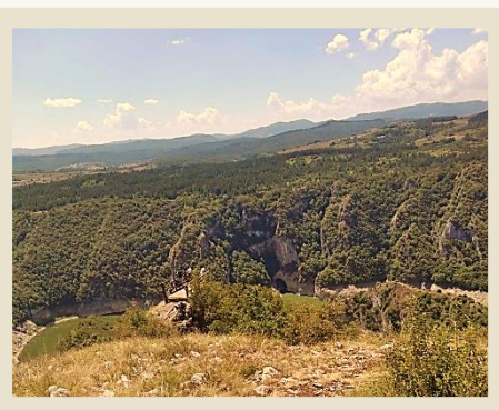
Моја слика из резервата природе „Увац“

ПАРК ПРИРОДЕ је подручје добро очуваних природних својстава вода, ваздуха и земљишта, преовлађујућих природних екосистема и без већих деградационих промена предеоног лика и у целини