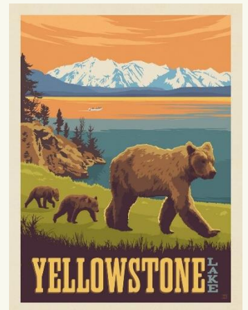
Плакат националног парка Јелоустон (Yellowstone) у Америци

На подручју Србије постоји пет националних паркова и то су: "Ђердап", "Тара", "Копаоник", "Фрушка Гора" и "Шар планина". Обухватају површину од око 1,75% територије Србије. Највећи међу њима је НП "Ђердап", а најмањи НП "Копаоник". Најстарији национални парк у Србији је НП "Фрушка Гора", проглашен 1960. године. Основне заједничке карактеристике, због којих су ова подручја проглашена за националне паркове су: богатство подручја аутохтоном, реликтним и